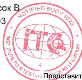
Мгг. Йиржи Хеш

Представитель Нотифицированного органа № 1023